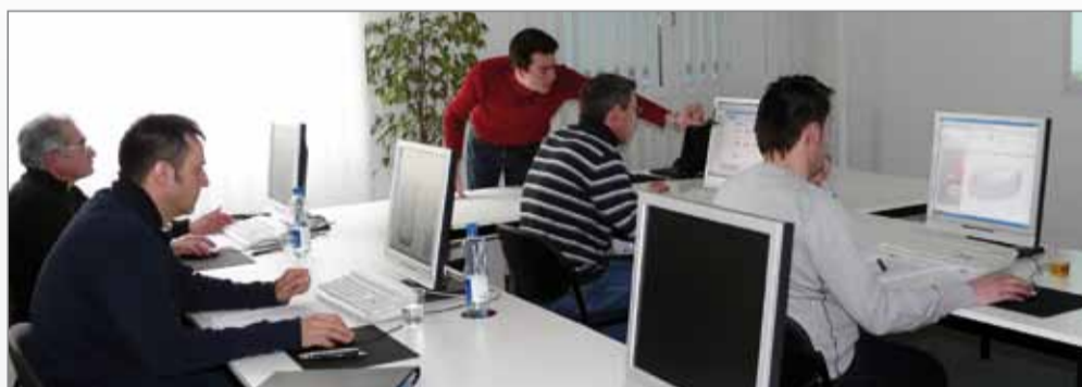
Beim Unterricht in kleinen Gruppen ist individuelle Hilfestellung möglich

Bausoft-Schulungen sind exakt auf die Bedürfnisse ihrer Kunden zugeschnitten